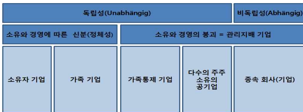
[그림 1] 기업정의 관점에서의 미텔슈탄트의 범위